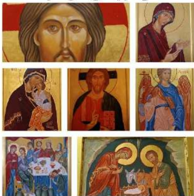
CASA DEL CANTICO - URBINO