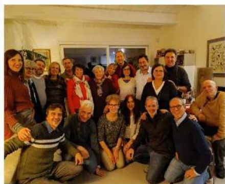
Casa dell'ecologia umana Roncosanbaccio Pesaro - Urbino