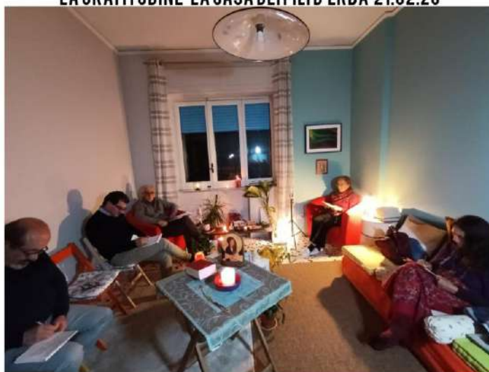
MEDITAZIONE E SCRITTURA AUTOBIOGRAFICA CONTEMPLATIVA

LA GRATITUDINE LA CASA DEI FILI D'ERBA 21.02.26